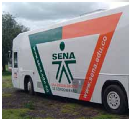
Laboratório de aprendizagem móvel do SENA

treinamento bilingüe através de uma ferramenta de reconhecimento vocal em tempo real e solicitação de certificados via correio eletrônico. Uma outra característica peculiar do SENA é que os programas foram iniciados utilizando somente o método de aprendizagem à distância e só recentemente é que o modelo de aprendizagem combinada foi adicionado para intensificar os programas de aprendizagem face a face. A partir de 2008 todos os alunos do SENA estarão usando o Blackboard, seja para aprendizagem à distância ou de forma combinada.