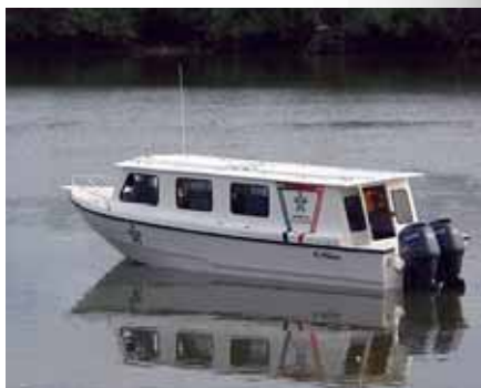
Por terra e por mar!

Através de sua parceria com o Blackboard's Managed Hosting e o Blackboard Training para criar o seu programa integral de aprendizagem eletrônica e de fácil acesso o SENA cumpriu com o seu objetivo estratégico de aumentar drasticamente o número de inscrições a cada ano. O trabalho árduo e a dedicação do SENA para oferecer uma educação aos colombianos foi reconhecido nacionalmente—